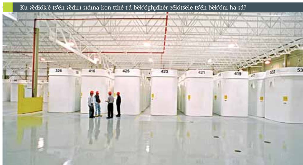
Ontario Power t'ok'e ʔelótséle hots'en ʔediri ʔidná kon tthé t'á bék'oghǵhǵhér t'ok'e bék'ónǵ ʔedǵhǵ.