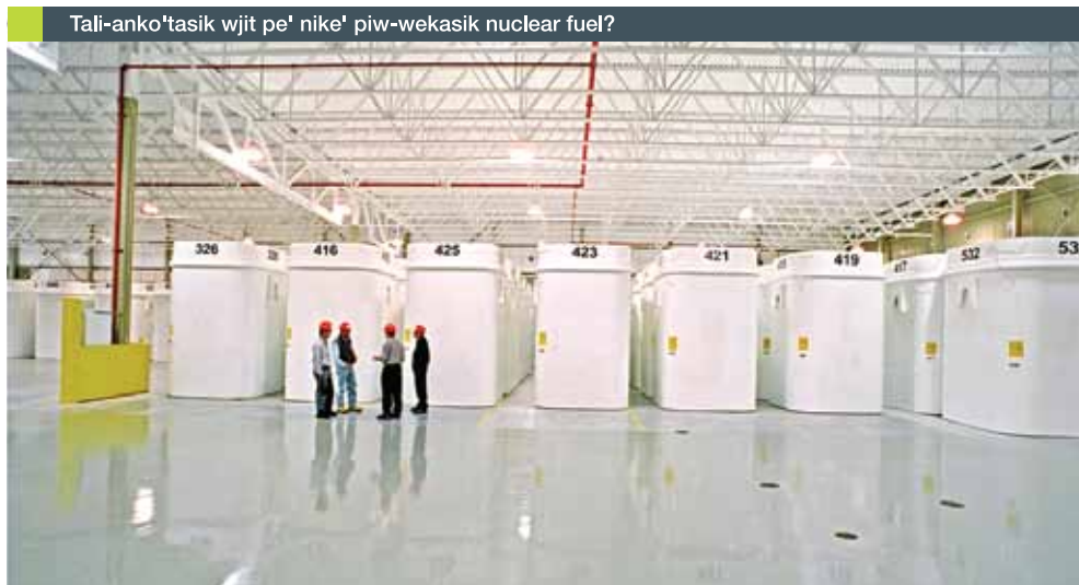
La'taqne'jk epultijik Ontario Power Generation's Western Waste Management Facility wjit ta'n etli-anko'tmumk piw-wekasik nuclear fuel.