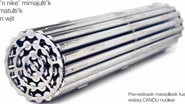
Piw-wekasik mawpilasik fuel wejjaq CANDU nuclear reactork epijik Kanata 0.5 metre tel-pittaql aqq 24 kilograms teliksukl.

Staqa se'k wsitqamu'k wmitkiwal ta'n ala'tu'tij nuclear power, Kanata nikanite'tk ta'n tl-maliaptiten elmi'knik. Kanata wskwiju'k telua'tijik westawik aqq weli-anko'tekemk maw-keknue'kl wjit nike' aqq elmi'knik, aqq ta'n nike' mimajulti'k amujpa mawi-apoqnmatalti'k kisa'tunenu kisite'taqn wjit ta'n ne'kaw tl-maliaptiten piw-wekasik nuclear fuel. Mita na'te'l wjiatew weli-ankweyujik aqq ikalujik mimajuinu'k aqq wsitqamuey.