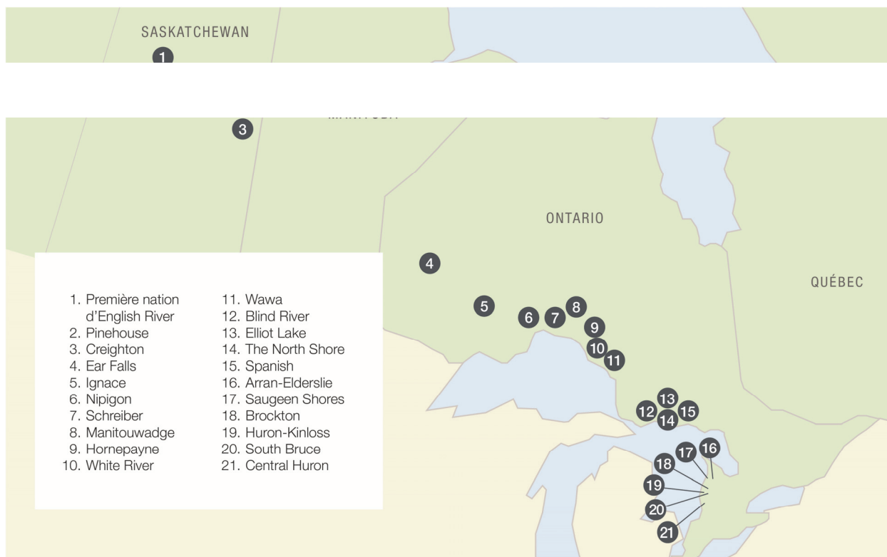
Figure 1 : Collectivités ayant demandé la tenue d'Évaluations préliminaires dans le cadre du processus de sélection d'un site

Les collectivités se sont engagées dans le processus de sélection d'un site en exprimant leur intention d'en apprendre davantage sur le plan canadien de gestion à long terme du combustible nucléaire irradié et sur le Projet de la GAP (Étape 2) en réponse à une invitation ouverte.