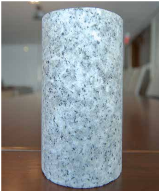
Exemple de carotte